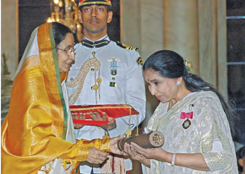
2008లో అప్పటి రాష్ట్రపతి ప్రతిభా పాఠేల సుపీ పద్మవిభూషణ్ అవార్డు అందుకుంటున్న ఆశోక్ సేన్ (స్టైల్)

గత పాలకులు చేసిన పనులు చూస్తే మతిపోయిందని, నూటికి 90 శాతం రెవెన్యూ సమస్యలపైనే అర్జీలు వచ్చేవని ఆశ్చర్యం వ్యక్తం చేశారు. మీకు భూ హక్కు ఇచ్చే బాధ్యత తీసుకోవాలని అప్పుడే సంకల్పించినట్లు చంద్రబాబు తెలిపారు. 1.12 కోట్ల పట్టాదారు పాస్ పుస్తకాలు ఇచ్చే బాధ్యత తీసుకుంటున్నారని. 16,816 గ్రామాలు 6 నర్సే చేయాలన్నారు. ఇప్పటికే 21.23 లక్షల కొత్త పాస్ పుస్తకాలు ప్రజలకు ఇచ్చామని తెలిపారు. జూలై నాటికి 9 లక్షల పాస్ పుస్తకాలు ఇస్తామని హామీ ఇచ్చారు. ఇంకా 80 లక్షల పాస్ పుస్తకాలు ఇవ్వాలని చంద్రబాబు వివరించారు. ప్రజలకు ఇచ్చే పాస్ పుస్తకాలను ఎవరూ తారుమారు చేయలేరు. కరెన్సీకి వాడే సాంకేతికత పట్టాదారు పాస్ పుస్తకాలకు వాడం. మీ ముందు నర్సే కేయింది రికార్డు చేస్తాం. ఈకేవైసీ చేశారే పట్టాదారు పాస్ పుస్తకం ఇస్తాం. భూ యజమాని సమక్షంలో మొత్తం ప్రక్రియ నిర్వహిస్తున్నాం. రూపాయి కూడా అమ్మితి తోకుండా పాస్ పుస్తకాలు ఇవ్వాలనేది నా ఆలోచన. రికార్డులు ట్యాంపర్ కాకుండా భాక్స్ డైన్ టెక్నాలజీ తెచ్చాం. పుస్తకాలపై కూడా కోడ్ ఇచ్చాం. మీ భూమి వేరే ఎవరూ రిజిస్ట్రేషన్ చేసుకోకుండా రికార్డులకు డిజిటల్ లాక్ చేసుకునే అవకాశం కల్పించాం. భూ సమస్యలకు శాశ్వతంగా పరిష్కారం చూపిస్తున్నామని ఈ సమాచారం ప్రజలకు అవగతమయ్యేటట్లుగా ప్రజాప్రతినిధులు వివరించాలని తెలిపారు.