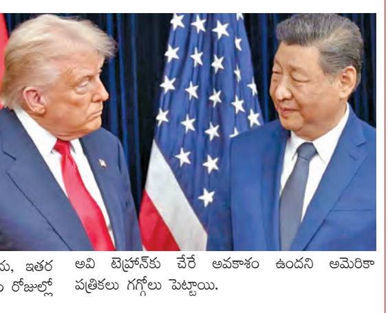
అవి టెక్నోసోఫీ చేరే అవకాశం ఉందని అమెరికా పత్రికలు గగ్గోలు పెట్టాయి.

మీడియా సంస్థలు తమపై నిరాధార ఆరోపణలతో కథనాలు ప్రసారం చేస్తున్నాయని విమ ర్శించింది. అయితే చైనా నుంచి ఆయు ధాలు అందినట్లు ఇరాన్ బహిరంగంగా వెల్లడించింది. కానీ, తాము అమెరికా విమానాలను విజయవంతంగా కూల్చి దానికి చైనా ఆయుధాలను వాడలేదని, తమ ఆధునాతన రక్షణ వ్యవస్థలే యూఎస్ విమానాలను కూల్చడానికి కారణమని ఇఆర్జీసీ వెల్లడించింది.భుజం మీద పెట్టుకొని ప్రయోగించే పార్టీ రోజే మిస్సైల్ లాంచరలను, ఇతర క్షిపణీ వ్యవస్థలను సరఫరాచేస్తున్నదని, వారం రోజుల్లో