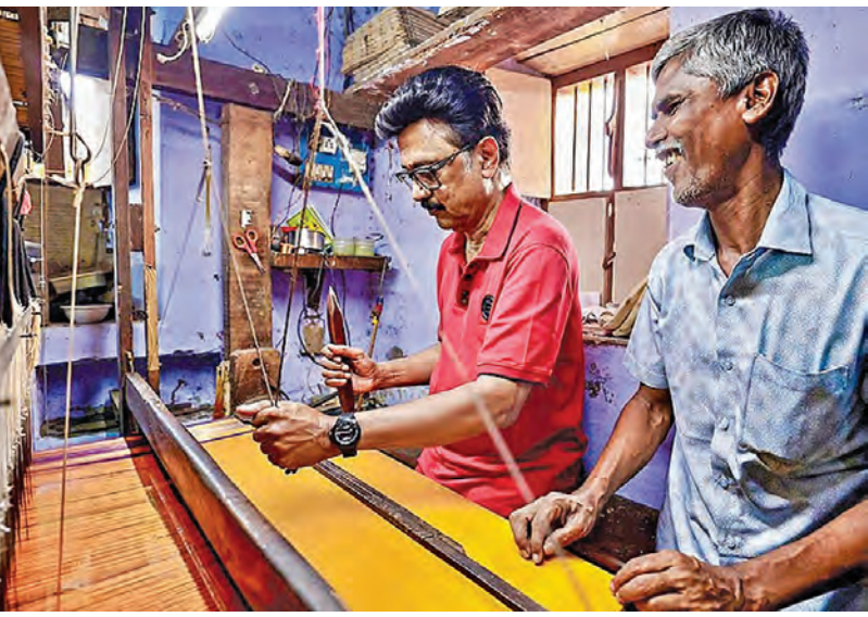
ఆదివారం ఎన్నికల ప్రచారంలో భాగంగా మగ్గం నేస్తున్న తమిళనాడు సింం స్టాలిన్

చర్యల వైఫల్యం తర్వాత అమెరికా వైస్ జెడివాన్స్ ఇన్ఫామాబాన్ వేదికగా 21 గంటలకు పైగా సాగిన ఈ మంతనాలు