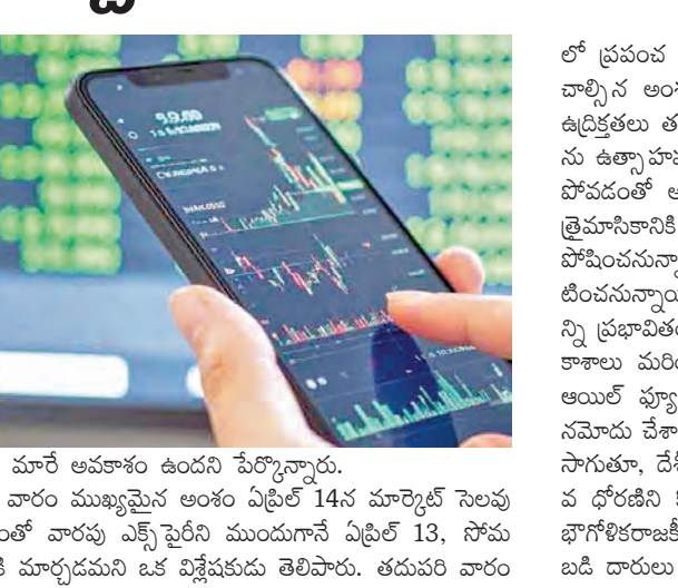
ధోరణి మారే అవకాశం ఉందని పేర్కొన్నారు.

ముంబై, ఏప్రిల్ 12 : పరుగులు ఆరు వారాల పతనానంతరం బలమైన రికవరీ నమోదు చేసిన భారతీయ స్టాక్ మార్కెట్, కొత్త వారంలో జాగ్రత్తలతో కూడిన ఆశావాద ధృక్పథంలోకి ప్రవేశిస్తోంది. భౌగోళికరాజకీయ ఉద్రిక్తతలు తగ్గి అవకాశాలు మరింత దేశీయ స్థూల ఆర్థిక పరిస్థితులు స్థిరంగా ఉండటంతో పెట్టుబడిదారుల నమ్మకం పెరిగింది. ప్రపంచ సంకేతాలు, కార్పొరేట్ ఫలితాలు, కర్మణ్య మార్పులు రాబోయే రోజుల్లో మార్కెట్ దిశను నిర్ణయించే అవకాశం ఉంది. గత వారం భారతీయ ఈక్విటీ సూచీలు బలంగా పుంజుకున్నాయి. బెంచ్మార్కు సూచీలు దాదాపు 6 శాతం పెరిగి వారాంతానికి సమీప గరిష్ఠ స్థాయిల వద్ద ముగిశాయి. సీపీ 24,050.60 వద్ద స్థిరపడగా, సెన్సెక్స్ 77,550.25 వద్ద ముగిసింది. ప్రపంచ పరిణామాలు ఆసక్తికరంగా ఉండటం మరింత దేశీయ ఆర్థిక స్థితి బలంగా ఉండటం పెట్టుబడిదారులను ఉత్సాహపరిచింది. సీపీ సాంకేతిక ధృక్పథం నిపుణులు మాట్లాడుతూ, 24,000 స్థాయికి దిగువన స్థిరమైన ట్రేక్ వస్తే, ఇటీవలి పెరుగుదల ధోరణి తిరోగమించి మళ్లీ 'సెల్' అందే ఐతే మార్కెట్